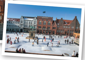
Vinterens skøjtebane på Torvet