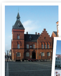
Ting- og Arresthuset