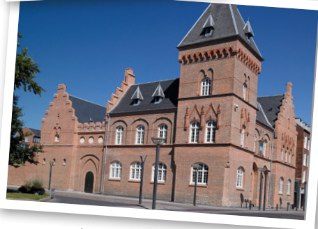
Ting- og Arresthuset

Byen talte 400 sjæle, og de fleste boede i Havnegade og Smedegade. I 1875 var der faktisk kun 2 huse på 2 etager i byen.