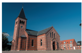
Vor Frelsers Kirke